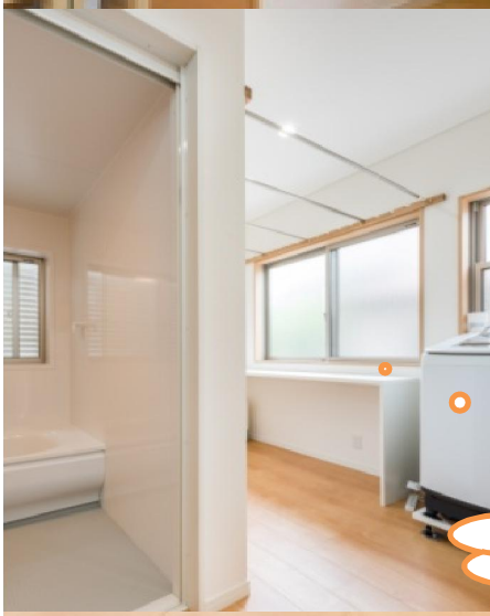
脱衣室と繋がる室内物干場